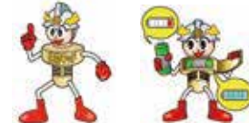
長野市消防局住宅用火災警報器キャラクター「住警キッド」「住警キッド Ver.2」