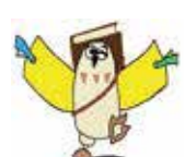
長野市子ども読書活動推進イメージキャラクター「BOOK(ブック)のろう」