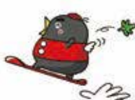
飯綱高原スキー場キャラクター「 」