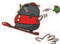
飯綱高原スキー場キャラクター「づなっち」