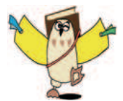
長野市子ども読書活動推進イメージキャラクター「BOOK(ブック)のろう」