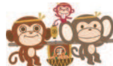
松代町キャラクター「六モンキー家族」