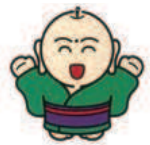
豊野町キャラクター「ゆたかちゃん」