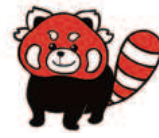
茶臼山動物園キャラクター「茶太郎」