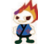
長野びんずるキャラクター「レン君」