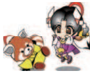
篠ノ井キャラクター「しの丸」と「おしのちゃん」