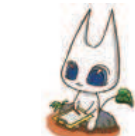
長野市環境学習イメージキャラクター「えこねこ」