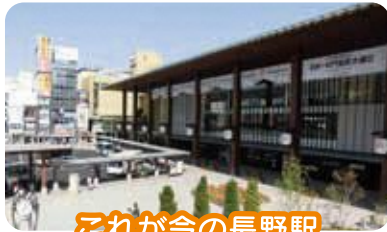
これが今の長野駅