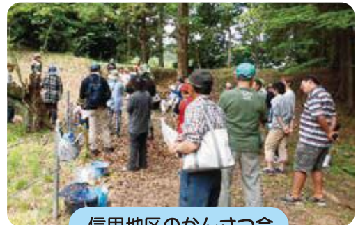
信里地区のかんせつ会