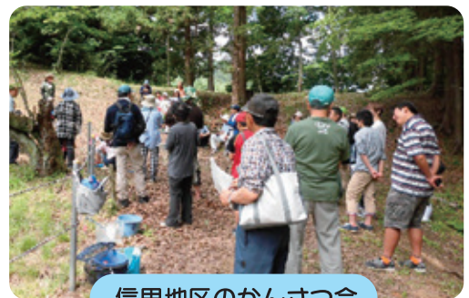
信里地区のかんせつ会

シナイモツゴは、コイの仲間です。長野市では、多くのため池がある篠ノ井信里地区に生息しています。県内では、長野市、上田市、栄村の3つの地いきでしか見つかっていない、とてもめずらしい魚です。長野市でも、「シナイモツゴ」を、大切に保ごうとする活動に取り組んでいる人たちがいます。