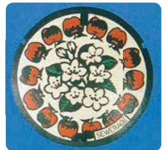
現在の長野市のマンホールのふた

長野市内に約6万5千個ある下水道マンホールのふたは、年代とともに変わっています。現在は、りんごとりんごの花のデザインのものが中心ですが、市内には、他のデザインのふたも見られます。