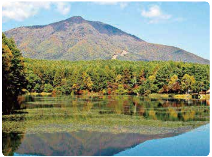
市民に親しまれている飯縄山

長野市は、平成17年に上水内郡の豊野町と戸隠村、鬼無里村、更級郡の大岡村と、平成22年に上水内郡の信州新町、中条村と合併して、より大きな「長野市」になりました。それまでの長野市の中で、標高が一番高い場所は、飯縄山頂上の1917mでした。5年生になると、学校の行事で飯縄山に登る人も多いはずですよ。他にも、聖山（1447m）や虫倉山（1378m）など、各地で親しまれている山も多くあります。今までに登ったことがある山はありますか？