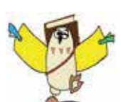
長野市子ども読書活動推進イメージキャラクター「BOOK(ブック)のろう」