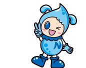
長野市上下水道局キャラクター「みずなちゃん」

答え Q1② Q2 1位 奈良市 2位 長野市 3位 大分市 Q3①② Q4② …次回の「なるほどワクワクながの」は2月上旬発行予定です。