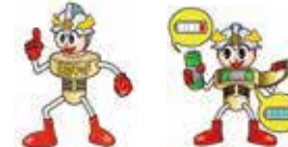
長野市消防局住宅用火災警報器キャラクター「住警キッド」「住警キッド Ver.2」