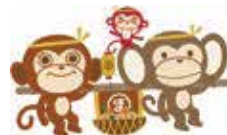
松代町キャラクター「六モンキー家族」