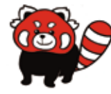
茶臼山動物園キャラクター「茶太郎」