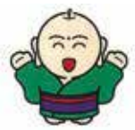
豊野町キャラクター「ゆたかちゃん」