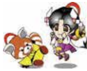
篠ノ井キャラクター「しの丸」と「おしのちゃん」