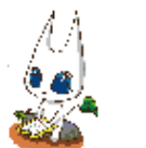
長野市環境学習イメージキャラクター「えこねこ」