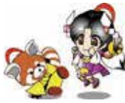
篠ノ井キャラクター「しの丸」と「おしのちゃん」