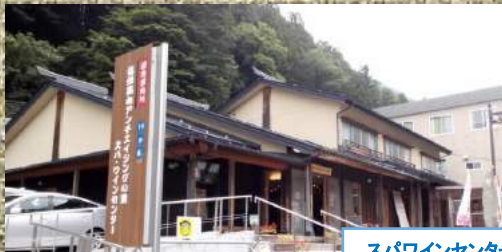
スパウインセンター(イメージ)

小学生 6,500円(税込) 未就学児 5,000円(税込) 3歳未満 無料 (3歳未満は食事・寝具は付きません)