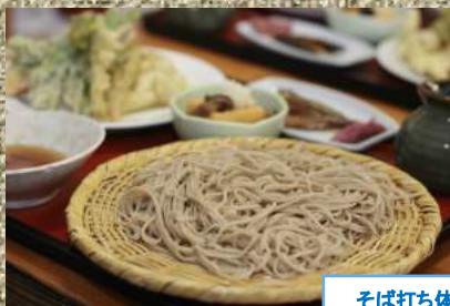
そば打ち体験(イメージ)