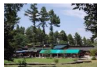
大池自然の家(イメージ)