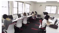
ワークセンター(イメージ)