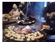
小川の庄(イメージ)