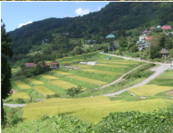
日本の棚田百選 栃倉の棚田