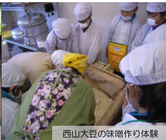
西山大豆の味噌作り体験